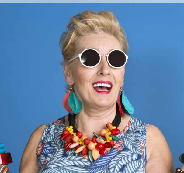
RITA Die vorzeitige, befristete Zusatzrente

ACHTUNG: vergangene Renditen sind nicht unbedingt ein Indikator für zukünftige