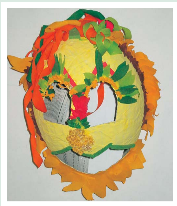
Geschützte Werkstatt/Laboratorio Protetto Bozen/Bolzano