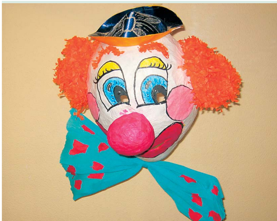
Geschützte Werkstatt/Laboratorio Protetto Bozen/Bolzano