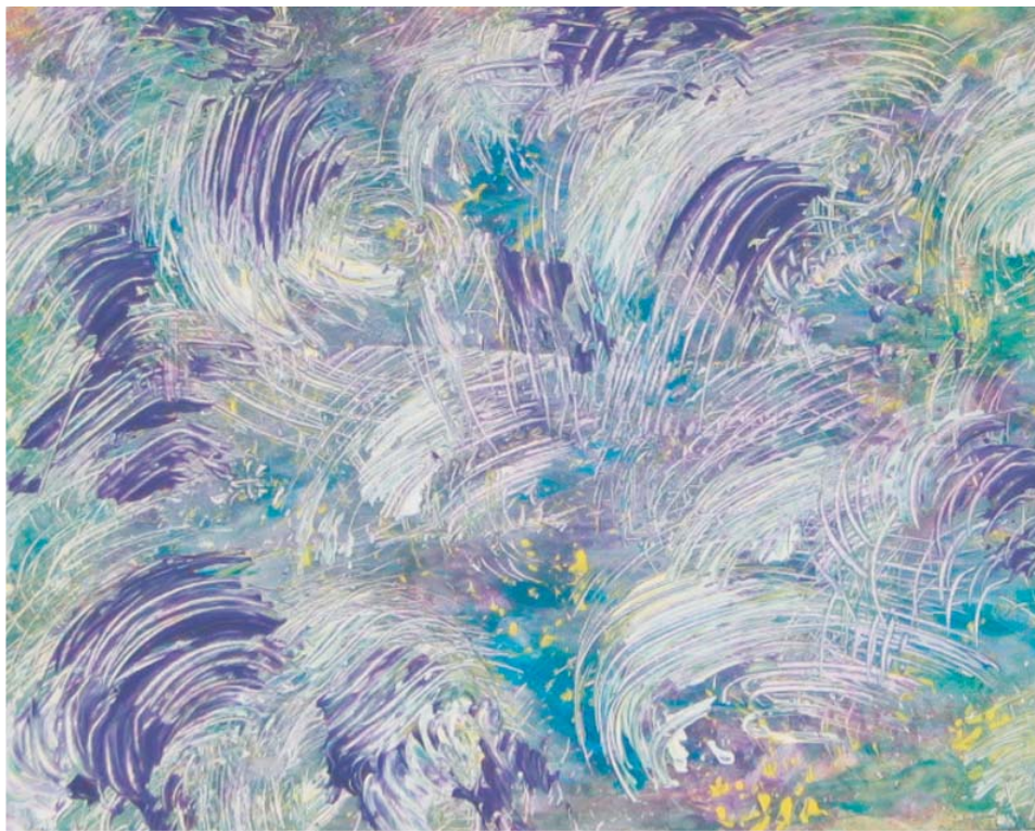
Geschützte Werkstatt/Laboratorio Protetto Bozen/Bolzano