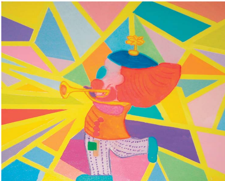
Geschützte Werkstatt/Laboratorio Protetto Bozen/Bolzano