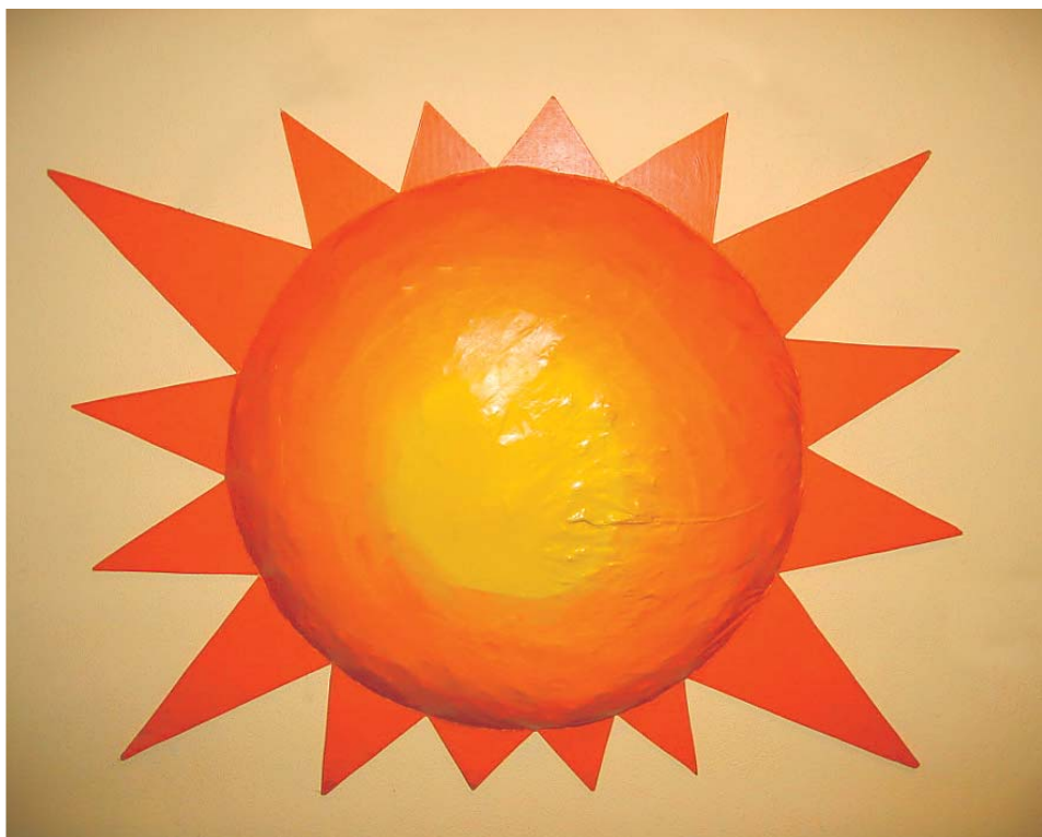
Geschützte Werkstatt/Laboratorio Protetto Bozen/Bolzano