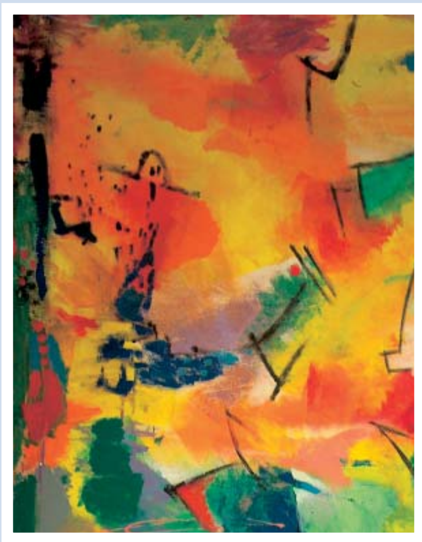
Gruppenarbeit Seeburg - Brixen/Bressanone