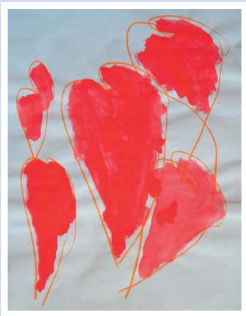
Loredana Seeburg - Brixen/Bressanone