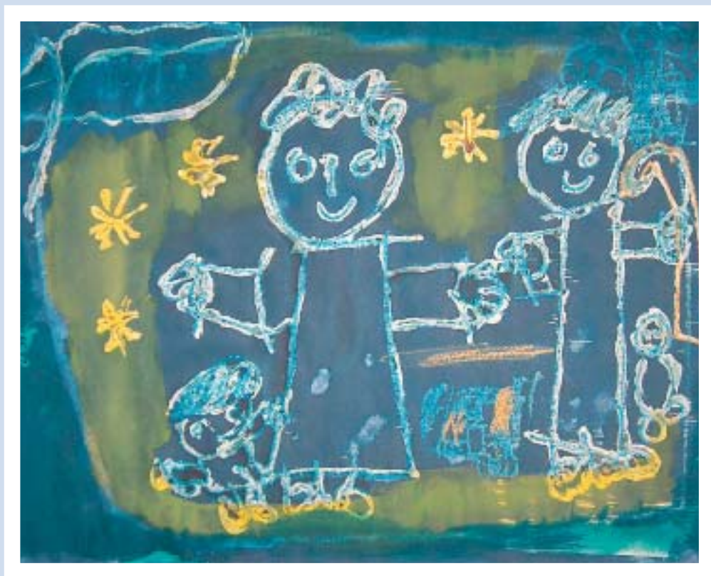
Lori Seeburg - Brixen/Bressanone