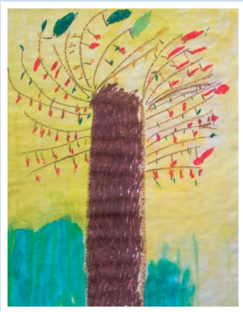
Christian Seeburg - Brixen/Bressanone