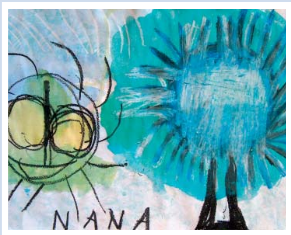
Nana Seeburg - Brixen/Bressanone