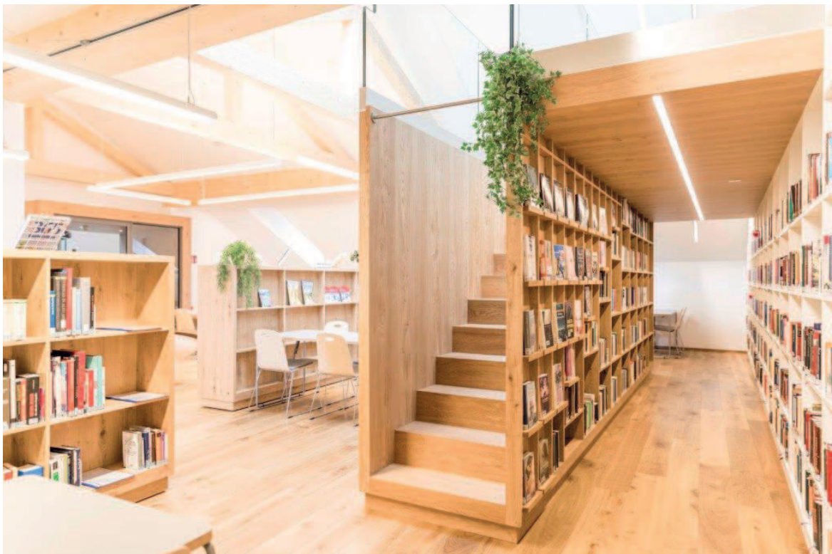
Aufgang zur Galerie