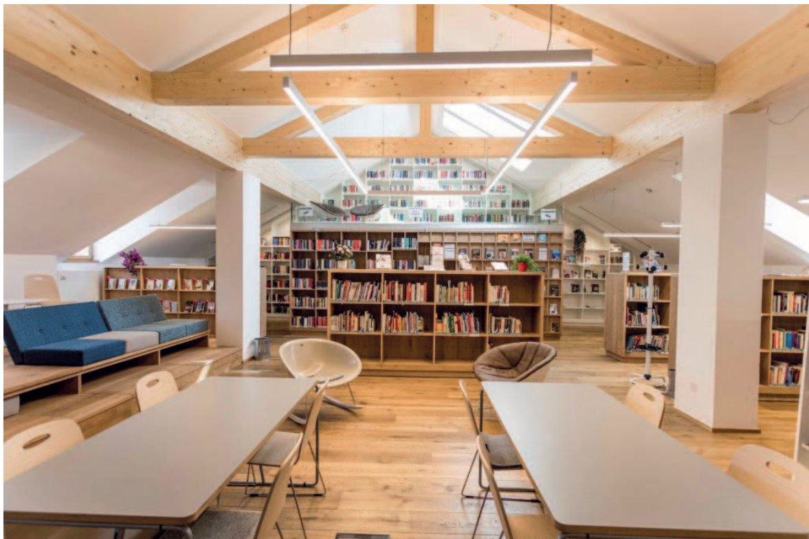
Dachgeschoss mit neuem Dachstuhl