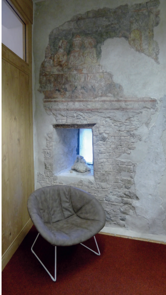
Das restaurierte Fresko im Eingangsbereich des „alten“ Teils der Bibliothek