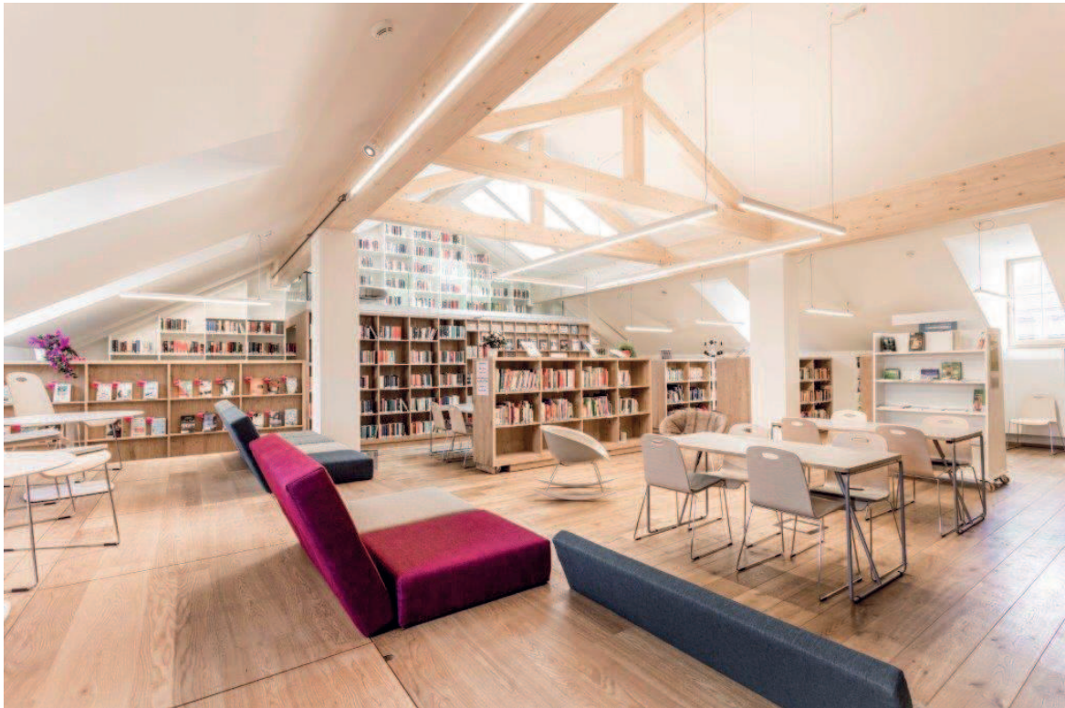
Multifunktionaler Bereich im Dachgeschoss