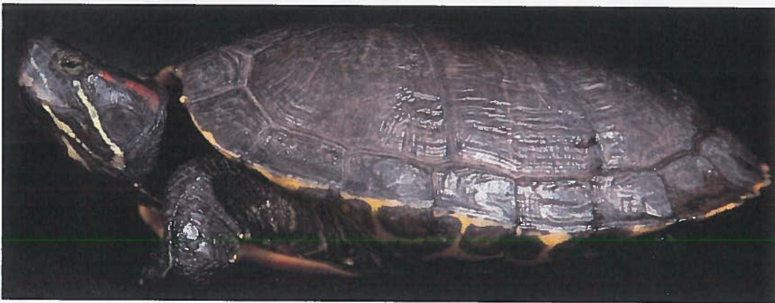
Rotwangen-Schmuckschildkröte Trachemys scripta elegans

Eine weitere Unterart, den oben abgebildeten Schildkröten sehr ähnlich, ist die Cumberland-Schmuckschildkröte Trachemys scripta troostii , mit orangem oder gelbem Wangenstrich.