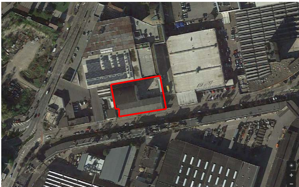
Figura 1: ortofoto di inquadramento del sito

Di seguito si riporta ortofoto di inquadramento territoriale del sito: