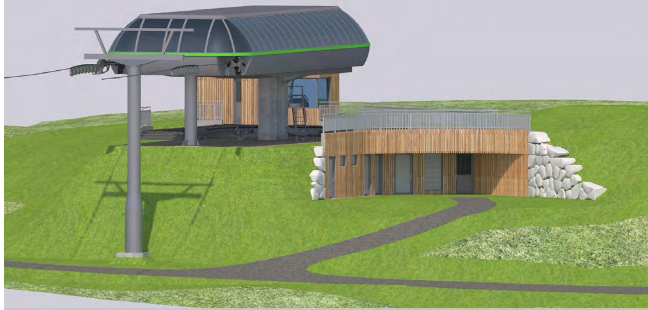
OST ANSICHT - VISTA EST