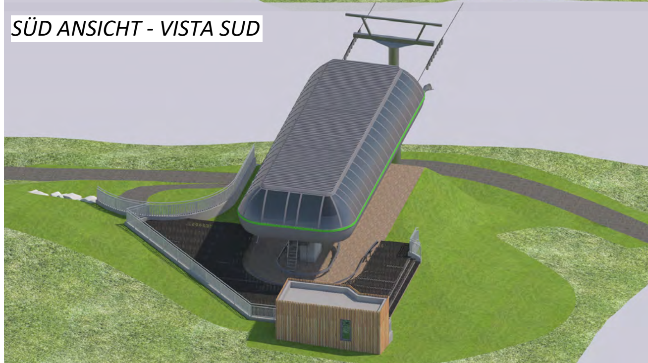
SÜD ANSICHT - VISTA SUD