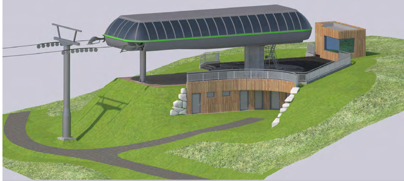
NORD-OST ANSICHT - VISTA NORD-EST