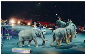
D: Im Zirkus