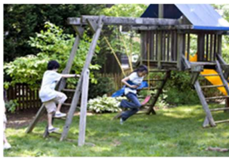
E: Auf dem Spielplatz