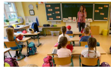
F: Beim Deutschunterricht