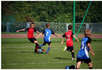
A: Auf dem Fußballplatz