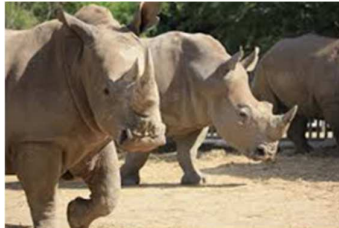
B: Im Zoo