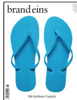
Brand eins Ausgabe August 2019