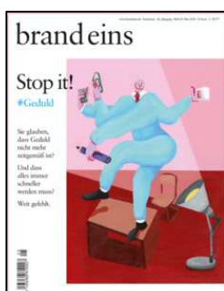
Brand eins Ausgabe Mai 2018

Stop it! #Geduld Sie glauben, dass Geduld nicht mehr zeitgemäß ist? Und dass alles immer schneller werden muss? Weit gefehlt.