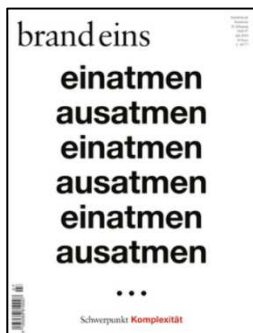
Brand eins Ausgabe Juli 2019