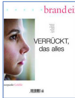
Brand eins Ausgabe April 2019 VERRÜCKT das alles.