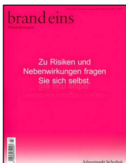
Brand eins Ausgabe März 2018

Zu Risiken und Nebenwirkungen fragen Sie sich selbst.