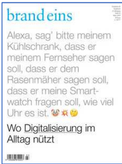
Brand eins Ausgabe März 2019 „Alexa, sag' bitte meinem Kühlschrank, dass er meinem Fernseher sagen soll, dass er dem Rasenmäher sagen soll, dass er meine Smartwatch fragen soll, wie viel Uhr es ist!“