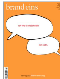
Brand eins Ausgabe Oktober 2019