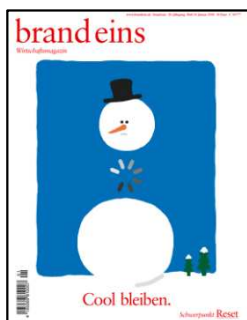
Brand eins Ausgabe Januar 2018