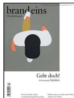
Brand eins Ausgabe April 2018