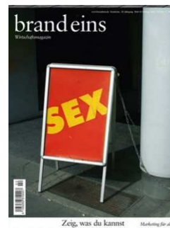
Brand eins Ausgabe Februar 2018