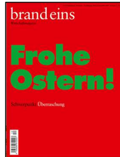
Brand eins Ausgabe Dezember 2017