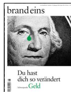
Brand eins Ausgabe Juni 2018

Stop it! #Geduld Sie glauben, dass Geduld nicht mehr zeitgemäß ist? Und dass alles immer schneller werden muss? Weit gefehlt.