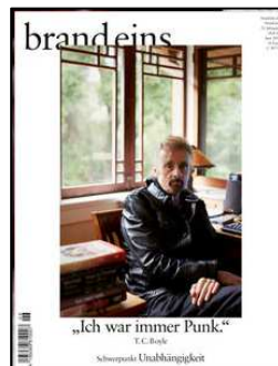
Brand eins Ausgabe Juni 2019 „Ich war immer Punk“