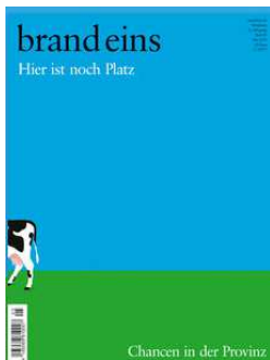
Brand eins Ausgabe Mai 2019 Hier ist noch Platz