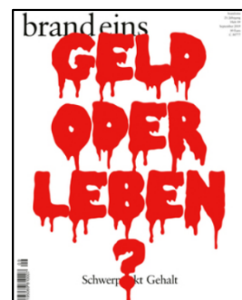
Brand eins Ausgabe September 2019