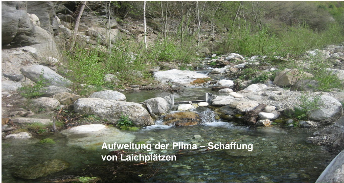
Aufweitung der Plima – Schaffung von Laichplätzen