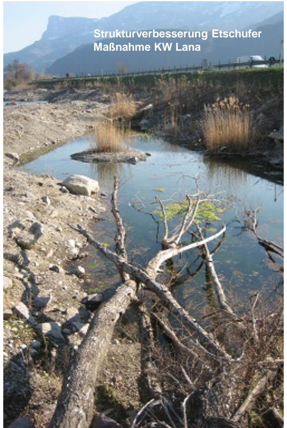
Strukturverbesserung Etschufer Maßnahme KW Lana