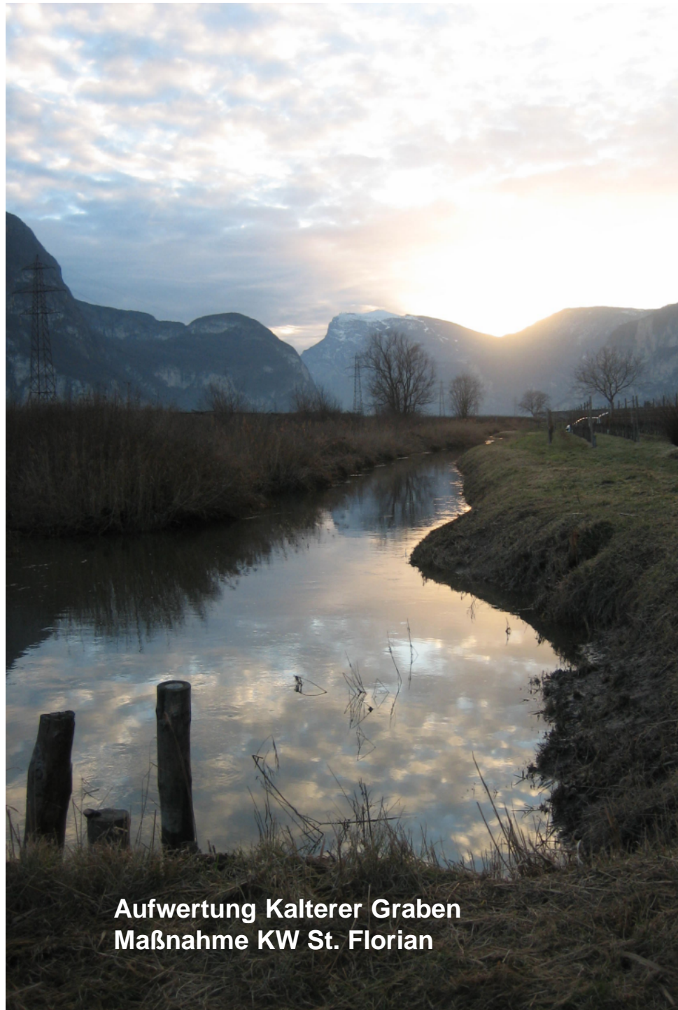
Aufwertung Kalterer Graben Maßnahme KW St. Florian