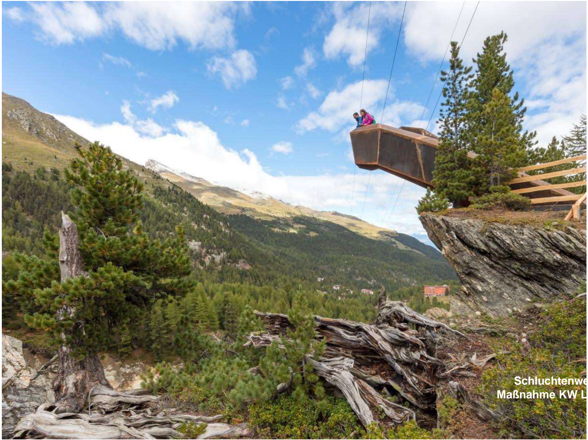
Schluchtenwe Maßnahme KW L