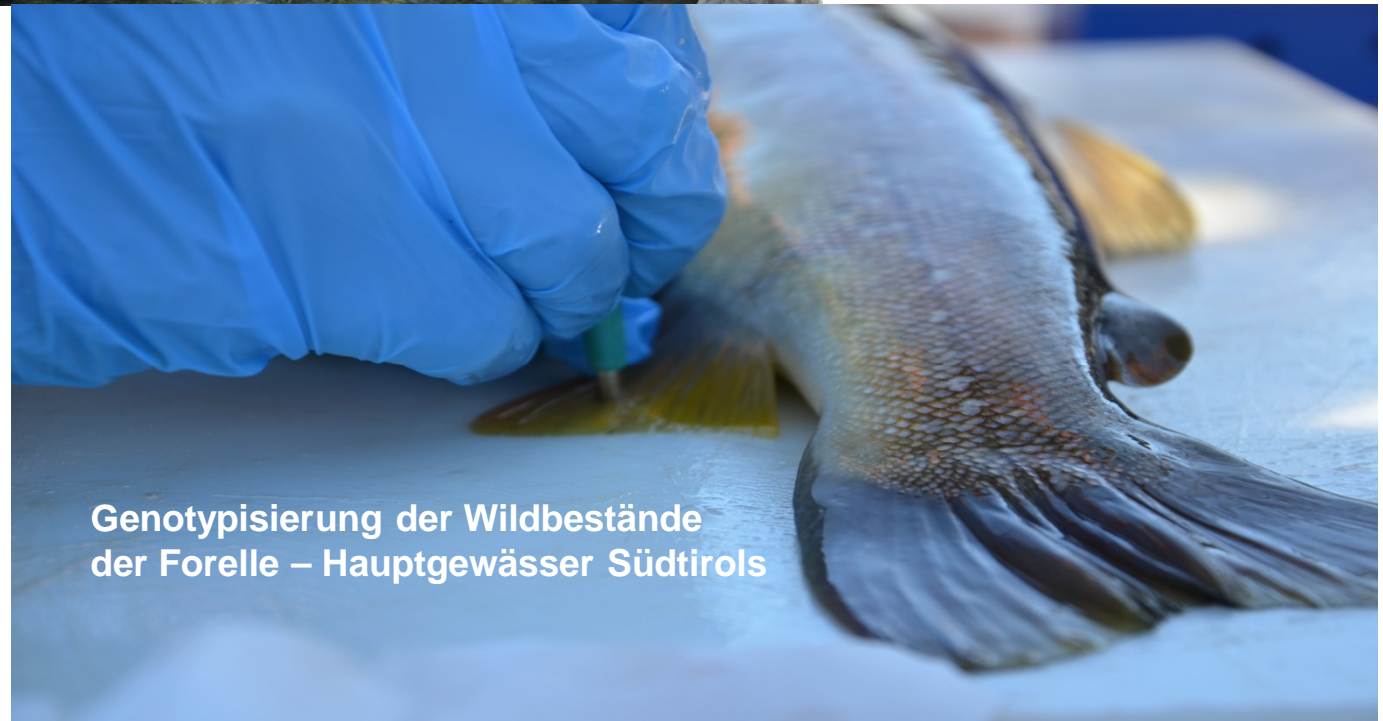
Genotypisierung der Wildbestände der Forelle – Hauptgewässer Südtirols