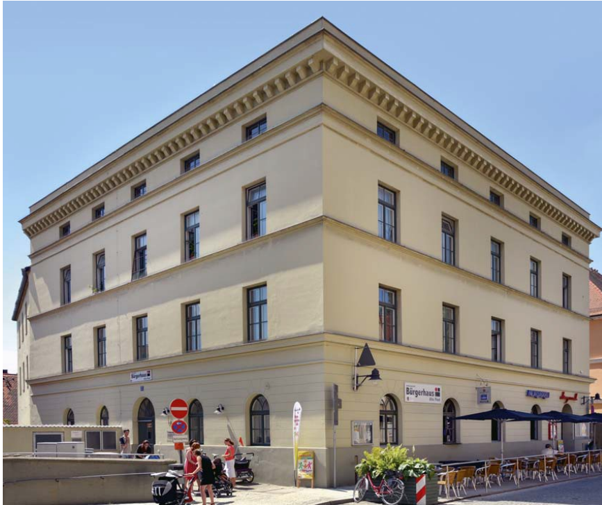
Bürgerhaus Alte Post

Stadt Ingolstadt Bürgerhaus das Mehrgenerationenhaus