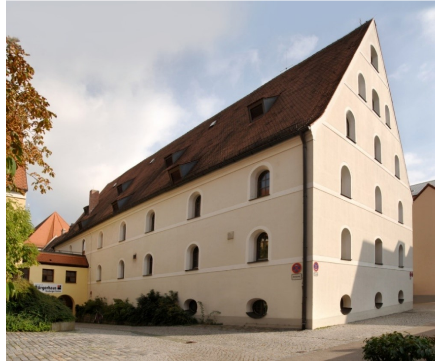
Bürgerhaus Neuburger Kasten