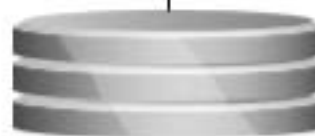
DB Oracle Spatial