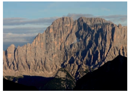
3 Pale di San Martino, Pale di San Lucano, Dolomiti Bellunesi, Vette Feltrine