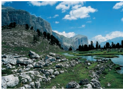
5 Dolomiti Settentrionali/Nördliche Dolomiten