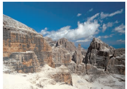
9 Dolomiti di Brenta