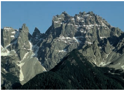
4 Dolomiti Friuliane/Dolomitis Furlanis, Dolomiti d'Oltre Piave