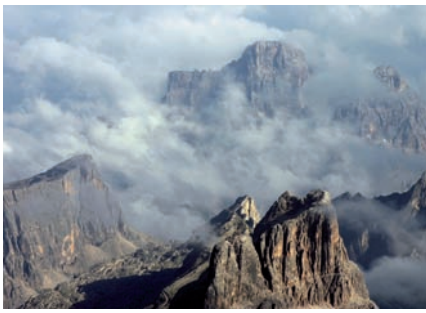
1 Pelmo-Croda da Lago