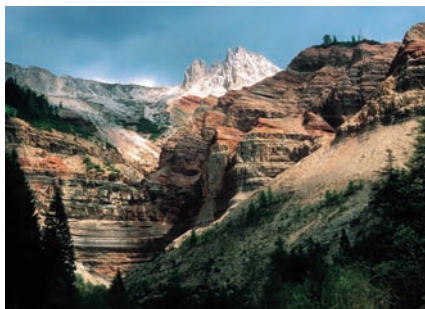
8 Rio delle Foglie/Bletterbach