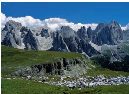
7 Sciliar-Catinaccio/Schlern-Rosengarten, Latemar