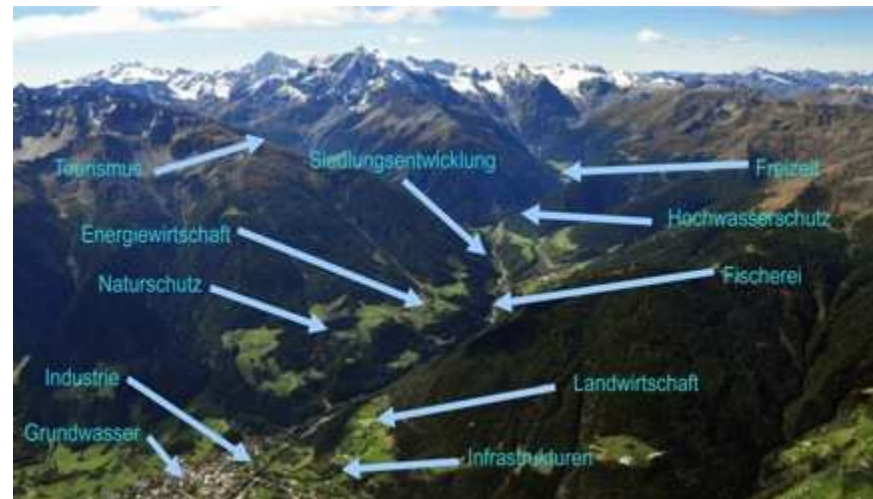
Nutzungen und Interessen

Das Modul „Terrestrische Ökologie“ beschäftigt sich mit den Lebensräumen der Flora und Fauna „am Land“. Im Projekt stehen jene Tier- und Pflanzenarten und deren Lebensräume im Mittelpunkt, die für alpine Gebirgsflüsse und deren Einzugsgebiete charakteristisch sind. Vorhandene Daten zum Vorkommen der Tier- und Pflanzenarten werden gesammelt, Kartierungen im Gelände durchgeführt und anschließend kartographisch dargestellt.