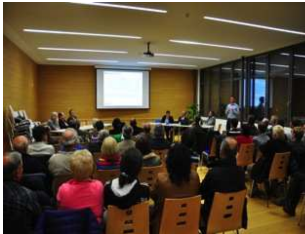
Bürgerversammlung Prad, 04. April 2014

Auf Nachfrage werden spezielle Veranstaltungen organisiert.