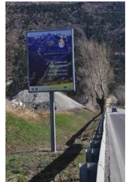
Infotafel entlang der Stilfserjochstraße

Zwei Informationstafeln in Spondinig und Stilfser Brücke im Zeitraum von März bis September 2014.