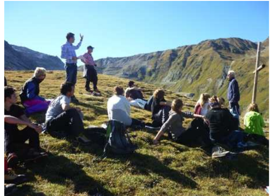
Gletschercamp, 20. September 2013