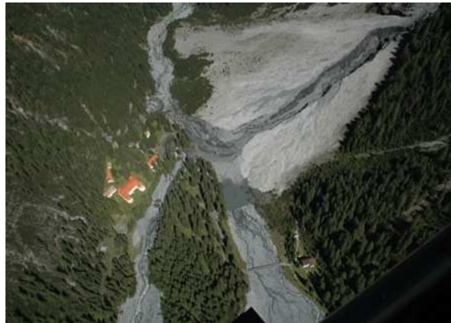
Drei Brunnen Trafoi 2012

Die bestehenden Wassergefahren werden beschrieben und kartografisch dargestellt. Die Ergebnisse können für die Erstellung des Gefahrenzonenplanes verwendet werden.